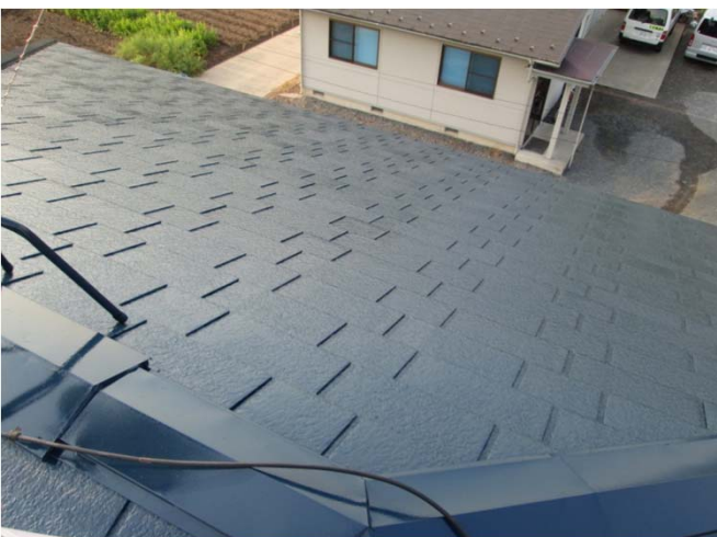
5. バイオマスシリコン 上塗り完了