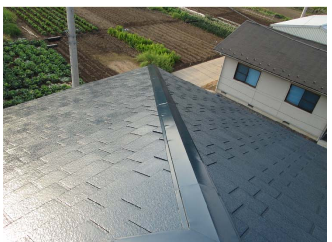
6. 施行後 色 バイオマスシリコン ナスコン使用