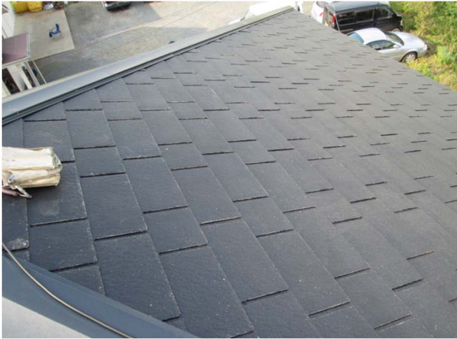
1. 高圧洗浄後 塗装前状況