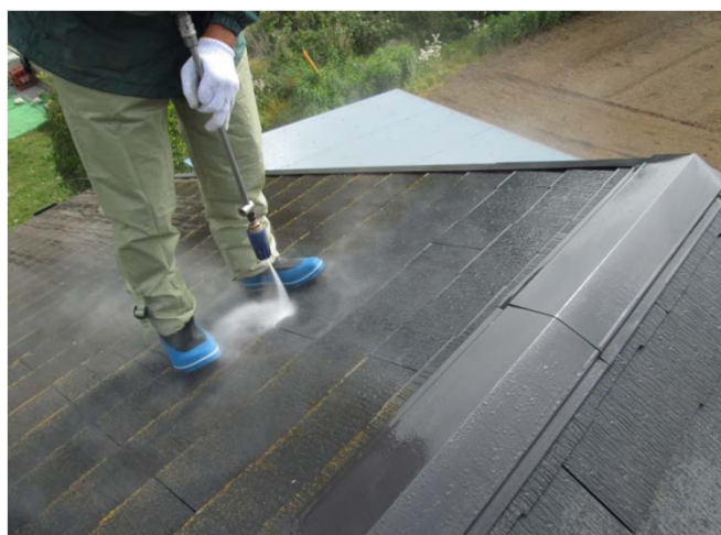
2. 高圧洗浄 状況