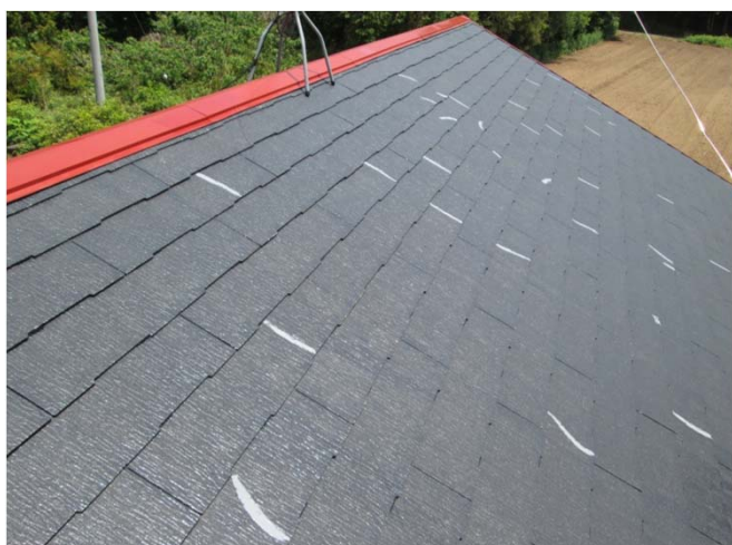
5. 棟板金サビ止め塗り ヒビ割れ補修