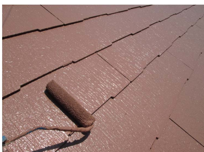
6. 仕上げ状況 2液型シリコン樹脂塗料2回塗り仕上げ ヤネフレッシュSI使用