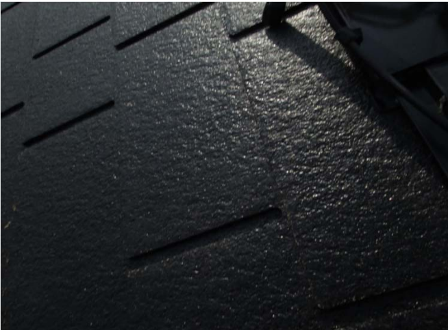
3. 2液型エポキシ樹脂シーラー 塗布状況