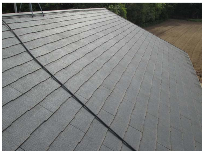
4. 2液型エポキシ樹脂シーラー塗布 マイルドシーラーエポ使用