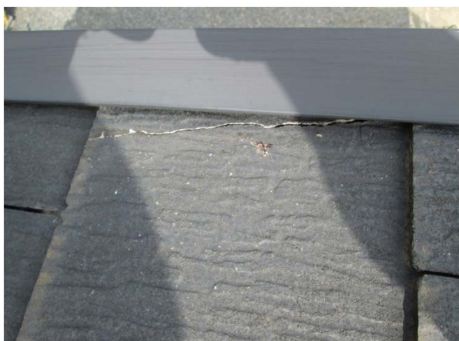
3. ヒビ割れ ノンブリード変性シリコンにて補修